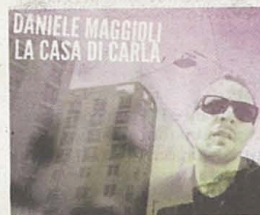
La copertina del disco

Il paesaggio è sempre stato il palinò di Daniele Maggioli, che sia quello urbano di città immaginarie o la riviera adriatica. È da sempre la cifra più peculiare della poetica del cantautore riminese, il cui sguardo spazia da una sete di naufragio metropolitano a un sarcasmo cinico più tipicamente romagnolo. Nel suo ultimo lavoro però i panorami si fanno interiori: vedute di amori lontanissimi, dediche, squarci emotivi, nostalgie cinematografiche. Atmosfere in bilico tra sogno e realtà, inciampi sintetici e sferzate acustiche. Canzoni d'amore viscerale o